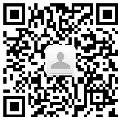
大牛招聘小助手微信号