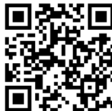
扫码进入网上招聘会